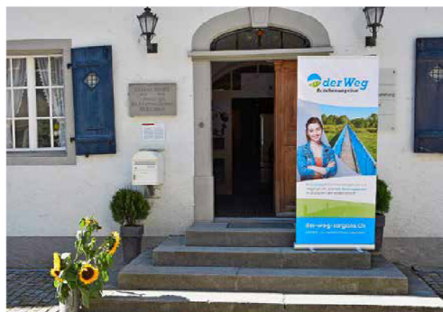
Das Brückenangebot «Der Weg» ist im Broderhaus in Sargans beheimatet. Es bietet eine abwechslungsreiche Zwischenlösung mit Praktika und Schulblöcken.

Gearbeitet wird bei «Der Weg» mit dem Bezugspersonensystem. Jede Schülerin und jeder Schüler erhält eine Person zugewiesen, welche das ganze Jahr für sie oder ihn zuständig ist. Diese Person unterstützt bei schulischen Fragen, Problemen oder Sorgen im Praktikum oder bei der Lehrstellensuche. Möglich ist auch die Vorbereitung auf eine weiterführende Schule. Dies wurde in den letzten Jahren immer wieder erfolgreich genutzt. Ebenso besteht ein Angebot für Sportlerinnen und Sportler. Diese können ihre Berufswahl mit der Sportkarriere verbinden und anschliessend entscheiden, welches die nächsten Schritte sind.